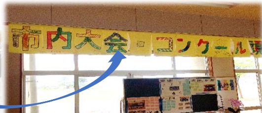
市内大会 選手激励会